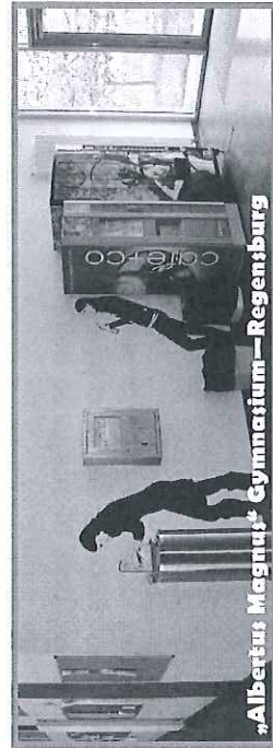
Albertus Magnus Gymnasium-Regensburg